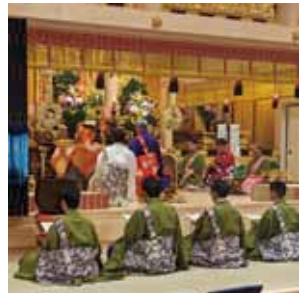
永代経法要 近隣寺院との勤行